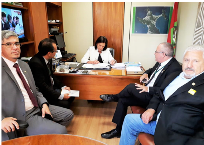
Deputada Angela Amin

Diante da entrega da nova proposta de Reforma Previdenciária ao Congresso, a equipe do SINPRF/SC, que já estava em Brasília, intensificou os trabalhos na Câmara dos Deputados e no Senado Federal. O foco das reuniões e visitas aos gabinetes foi pedir o apoio dos parlamentares para alterações no texto do projeto. Também foi solicitada a participação dos deputados na Frente Parlamentar em Defesa da PRF.