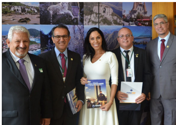
Deputada Geovania de Sá