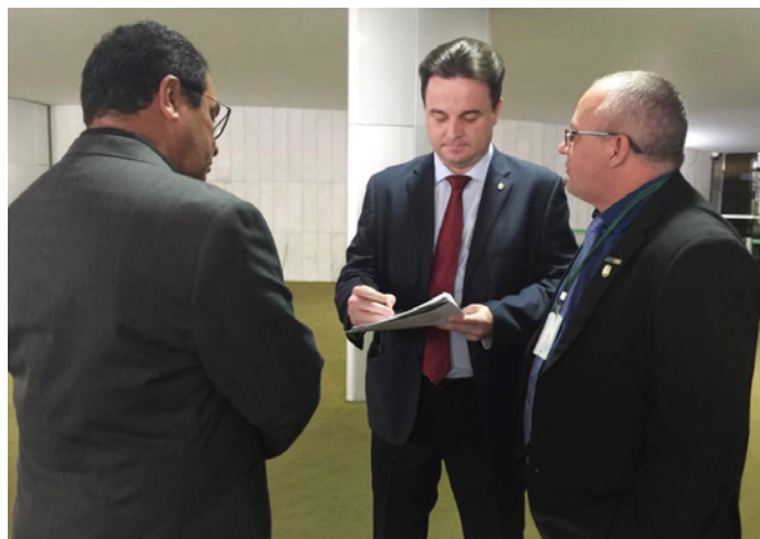
Deputado Rodrigo Coelho