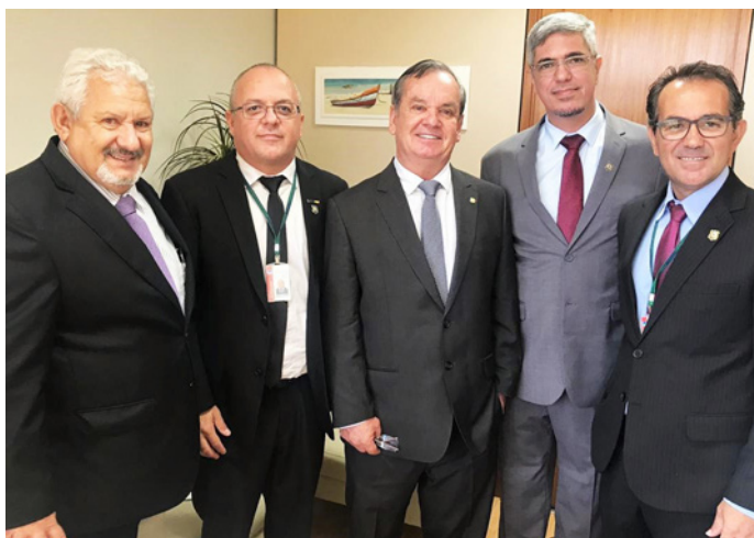
Deputado Rogério Peninha Mendonça