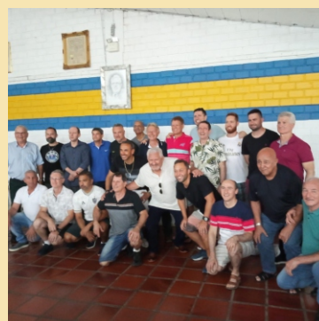
7ª Delegacia - Chapecó