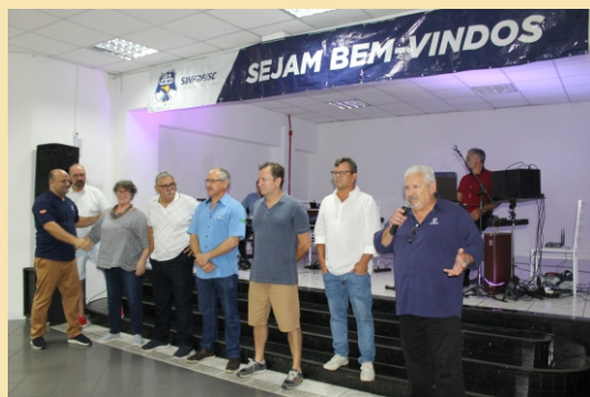
1ª Del, Sede e UniPRF