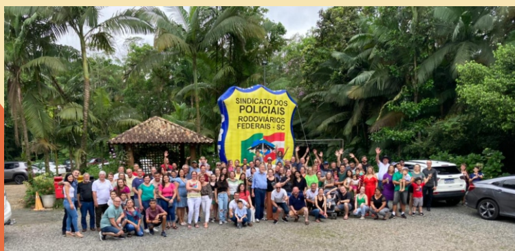
3ª Delegacia - Joinville