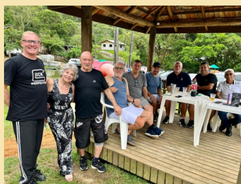
4ª Delegacia - Itajaí