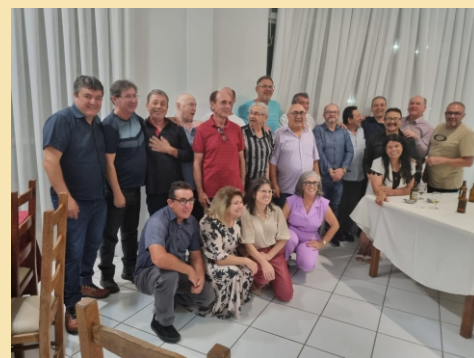
5ª Delegacia - Lages