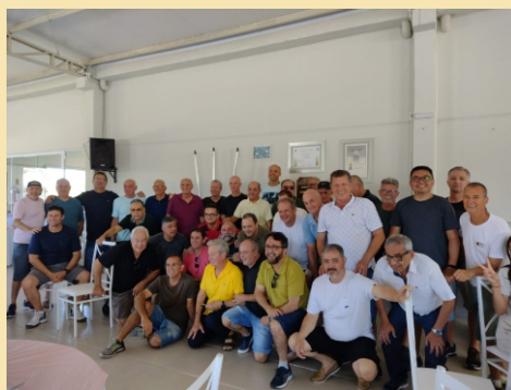
2ª Delegacia - Araranguá